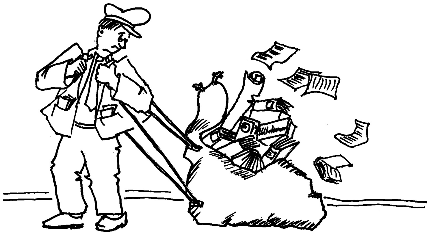
Tegning: Poul-Erik Rasmussen