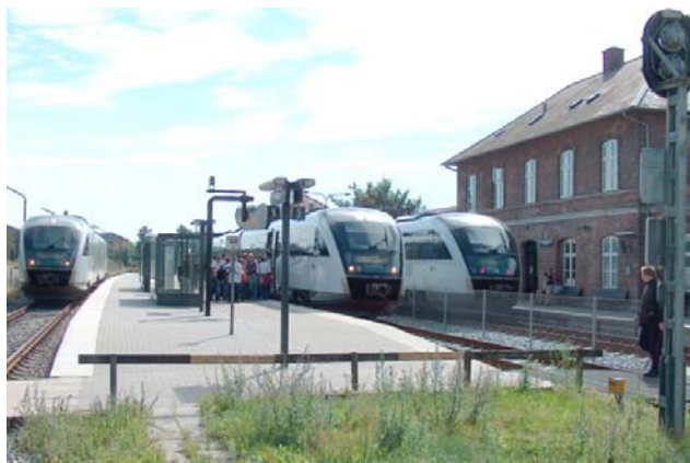
Trængsel på Ringe station

I Ringe er det også særlig problematisk. ”Ringetoget” fra Odense ankommer i spor 3, der ligger længst væk fra stationsbygningen, samtidig med at toget fra Svendborg ankommer i spor 2. Mange mennesker fra de to tog passerer således spor 1 for at komme til stationen samtidig med, at rejsende – ofte i løb – skal nå et af de to tog. Når toget fra Odense ankommer i spor 1 har vi miseren, da der altid er nogle, der skal udfordre skæbnen og mener de lige kan nå over.